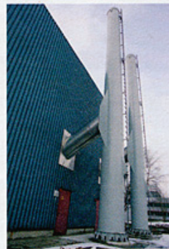
Planungssicherheit durch bestehende Wartungsgarantie.

der Zuverlässigkeit einer hochmodernen Anlage. Überdies besteht maximale finanzielle Planungssicherheit durch die über die gesamte Vertragslaufzeit (20 Jahre) bestehende Wartungs- und Instandhaltungsgarantie. Weitere Vorteile für den Kunden sind, die Verbesserung der Eigenkapitalquote die je nach angewandter Bilanzierungsmethode zum tragen kommt, ein gesteigerter Unternehmenswert sowie ein besseres Rating.